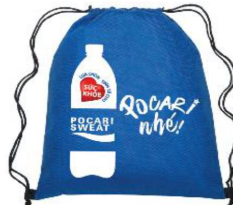
Drawstring bag ナイロンナップサック