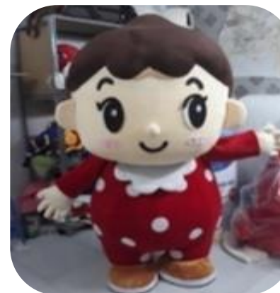
Wakodo mascot 着ぐるみ