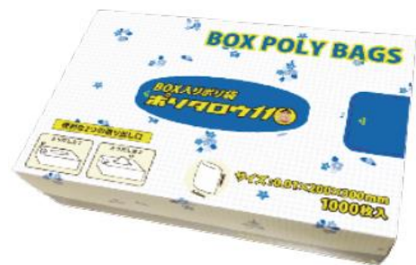
Food Bag Poly Taro11 箱入り食品用ポリ袋 小