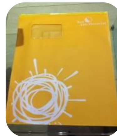
PVC holder cove 保険証ケース