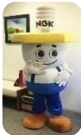
Sparky mascot 着ぐるみ