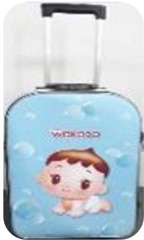
Wakodo suitcase スーツケース