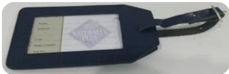
Luggage tag ネームタグ