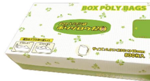
Food Bag Poly Jiro12 箱入り食品用ポリ袋 中