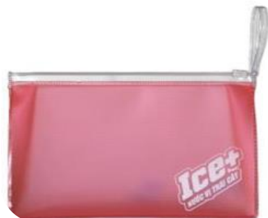
ICE+ pen case 塩ビバッグ