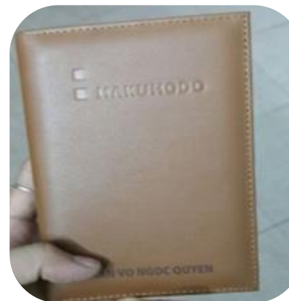
Passport holder パスポートケース