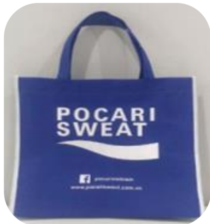
Promotion gift bag 不織布バッグ